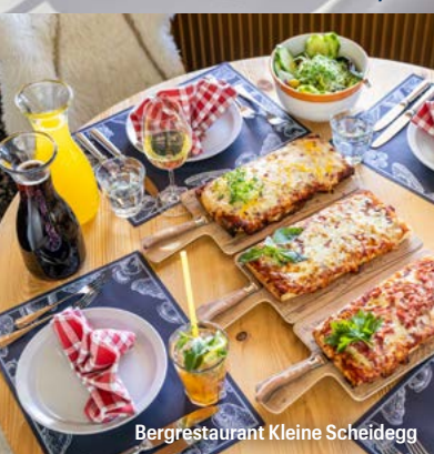
Bergrestaurant Kleine Scheidegg