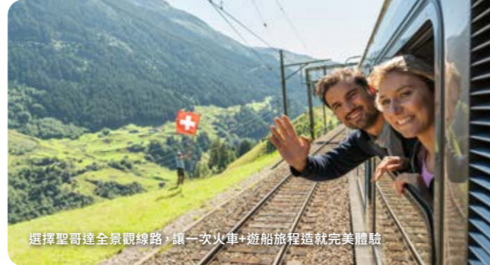
選擇聖哥達全景觀線路，讓一次火車、遊船旅程造就完美假期