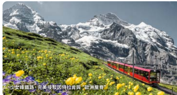
少女峰鐵路，完美接駁因特拉肯與歐洲屋脊