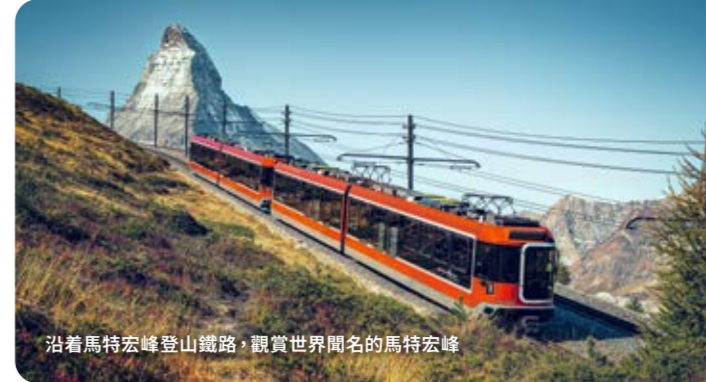
沿著馬特宏峰登山鐵路，觀賞世界聞名的馬特宏峰