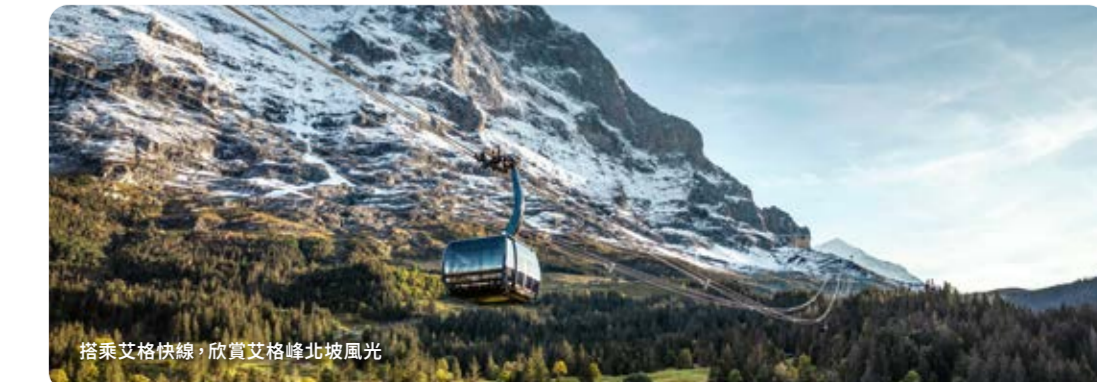
搭乘艾格快線，欣賞艾格峰北坡風光