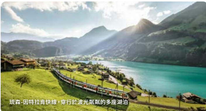
琉森-因特拉肯快車，穿行於波光粼粼的多座湖泊