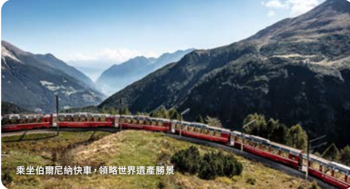
乘坐伯爾尼納快車，領略世界遺產風景