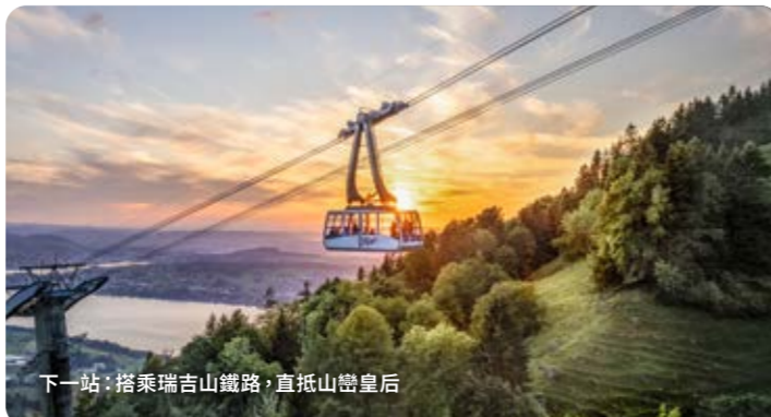
下一站：搭乘瑞士山鐵路，直抵山巔皇后