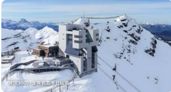
冰川3000，全年宛如冬日仙境