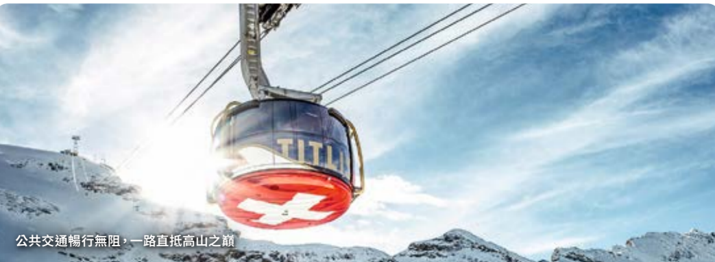
公共交通暢行無阻，一路直抵高山之巔

Lucerne-Engelberg Express | Die Zentralbahn | 持瑞士旅行交通證，可免費乘坐琉森Lucerne和英格堡Engelberg之間的天使之橋火車。