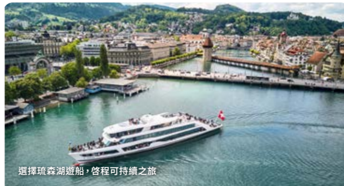
選擇琉森湖遊船，啓程可持續之旅