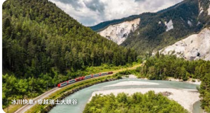
冰川快車，穿越瑞士大峽谷