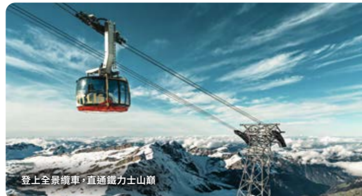
登上全覽纜車，直抵鐵力士山巔