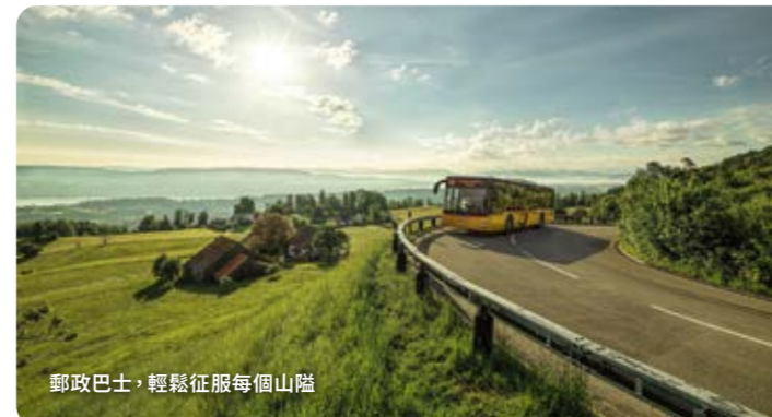
郵政巴士，輕鬆征服每個山巔