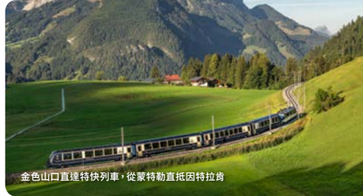
金色山口直達特快列車，從蒙特勒直抵因特拉肯