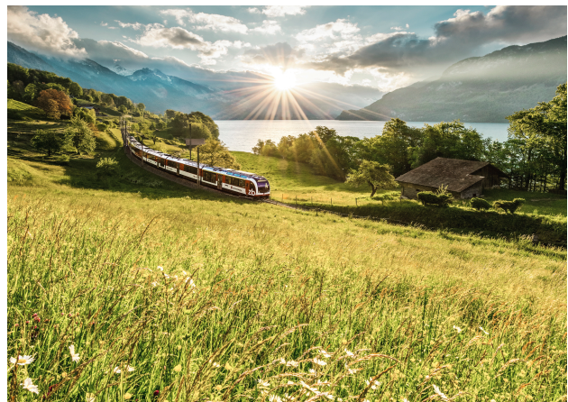
Luzern-Interlaken Express am Brienzersee, Berner Oberland