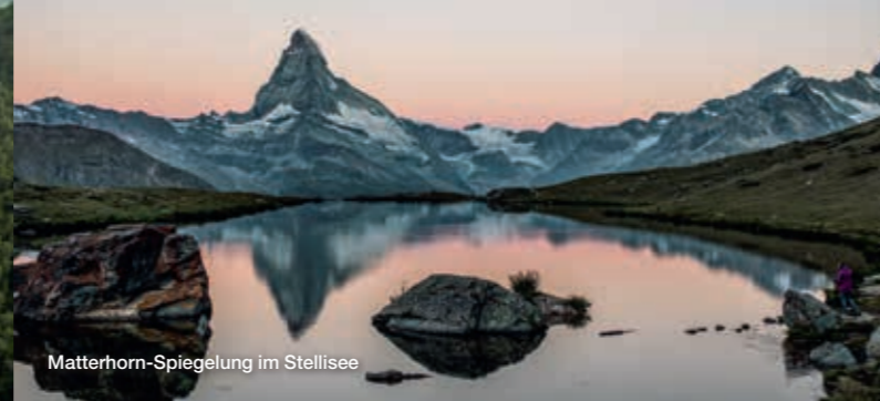
Matterhorn-Spiegelung im Stellisee