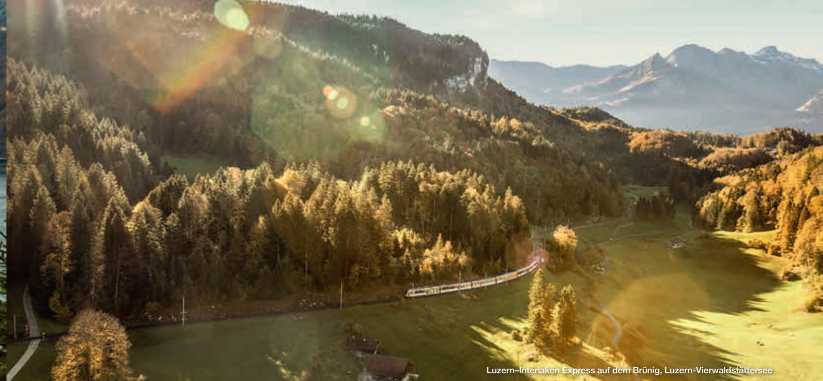
Luzern-Interlaken Express auf dem Brünig, Luzern-Vierwaldstättersee