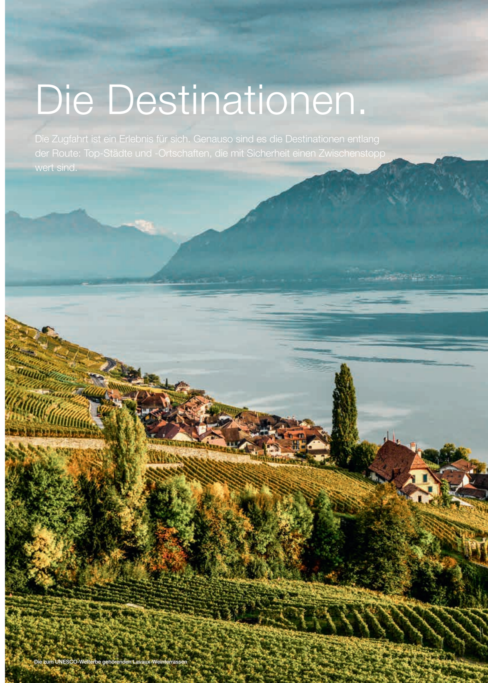
Die zum UNESCO-Welterbe gehörenden Lavaux-Weinterrassen

Die Zugfahrt ist ein Erlebnis für sich. Genauso sind es die Destinationen entlang der Route: Top-Städte und -Ortschaften, die mit Sicherheit einen Zwischenstopp wert sind.