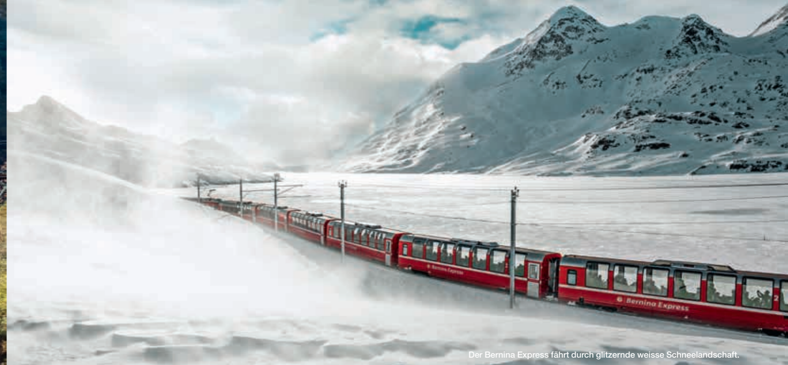
Der Bernina Express fährt durch glitzernde weisse Schneelandschaft.