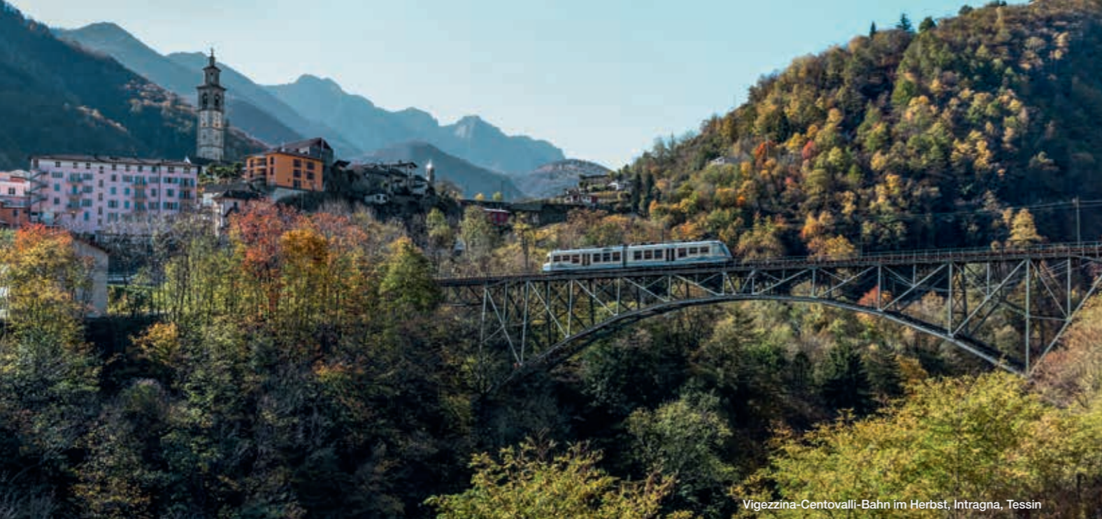
Vigezzina-Centovalli-Bahn im Herbst, Intragna, Tessin