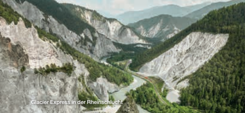
Glacier Express in der Rheinschlucht