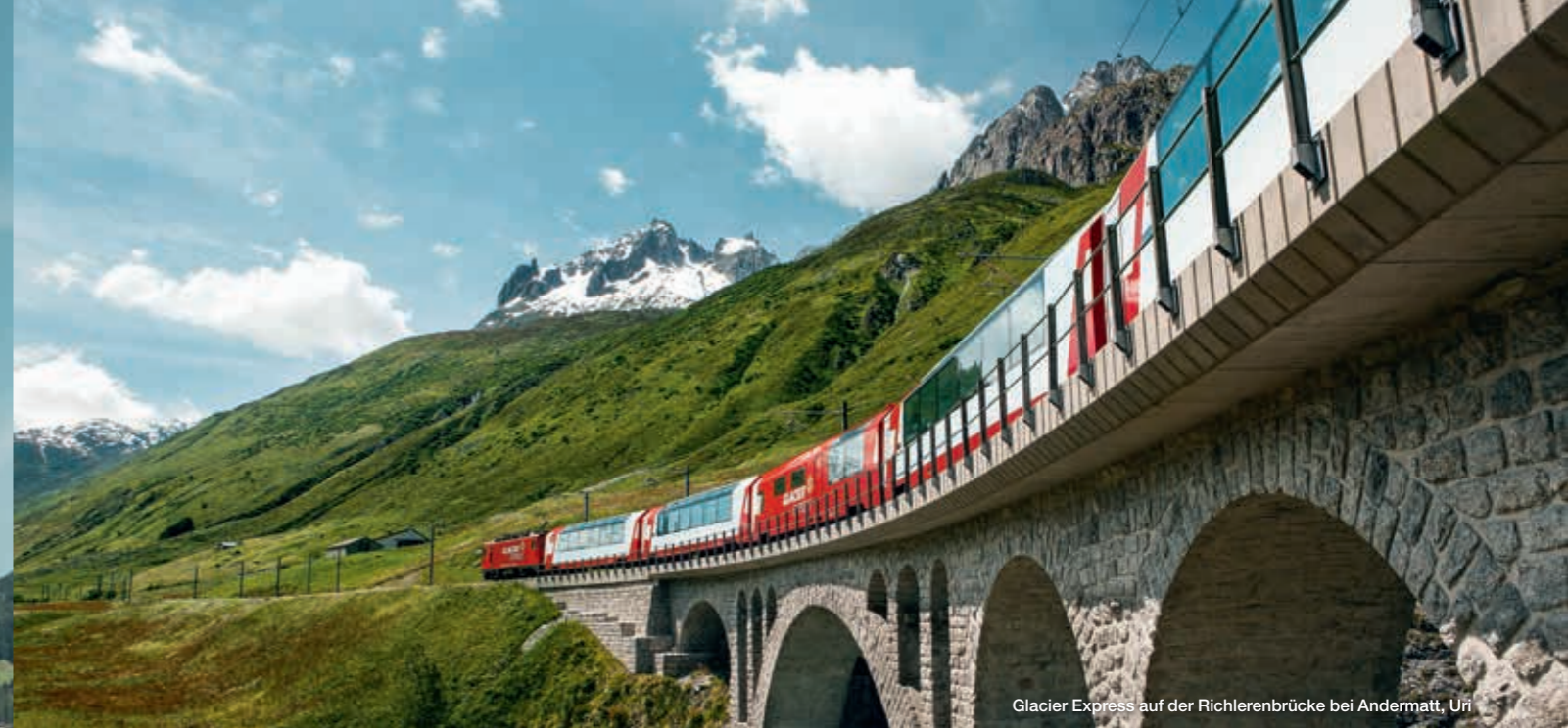
Glacier Express auf der Richlerenbrücke bei Andermatt, Uri