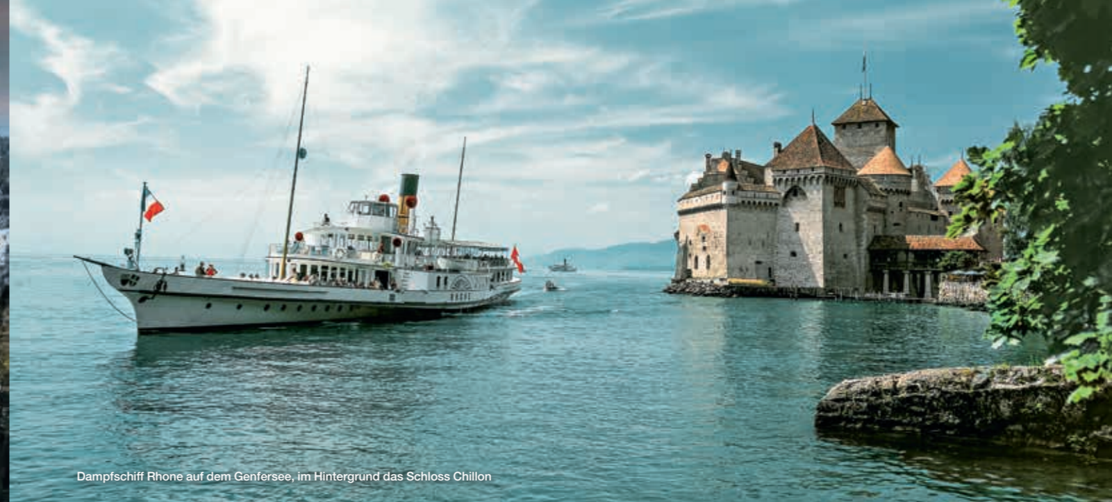
Dampfschiff Rhone auf dem Genfersee, im Hintergrund das Schloss Chillon