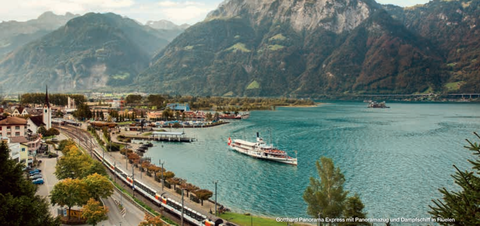
Gotthard Panorama Express mit Panoramazug und Dampfschiff in Flüelen