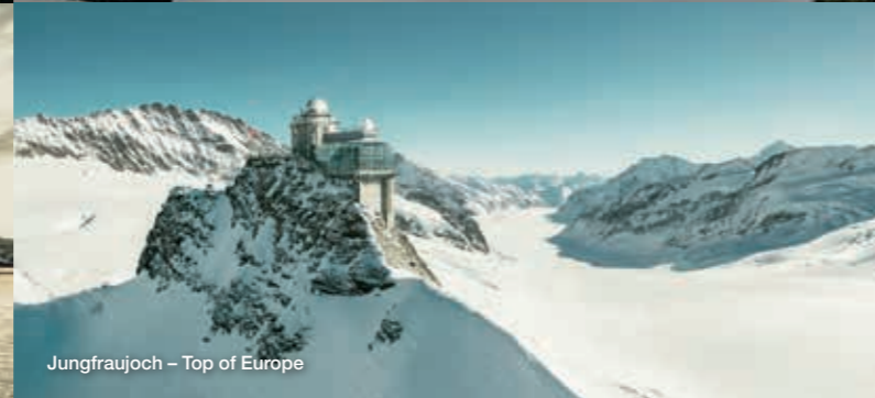
Jungfrauoch – Top of Europe