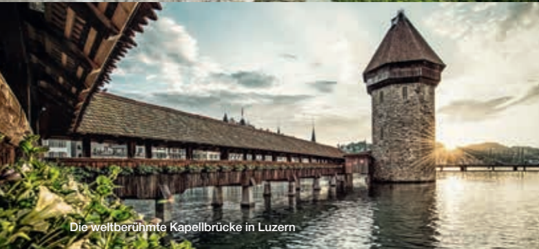
Die weltberühmte Kapellbrücke in Luzern