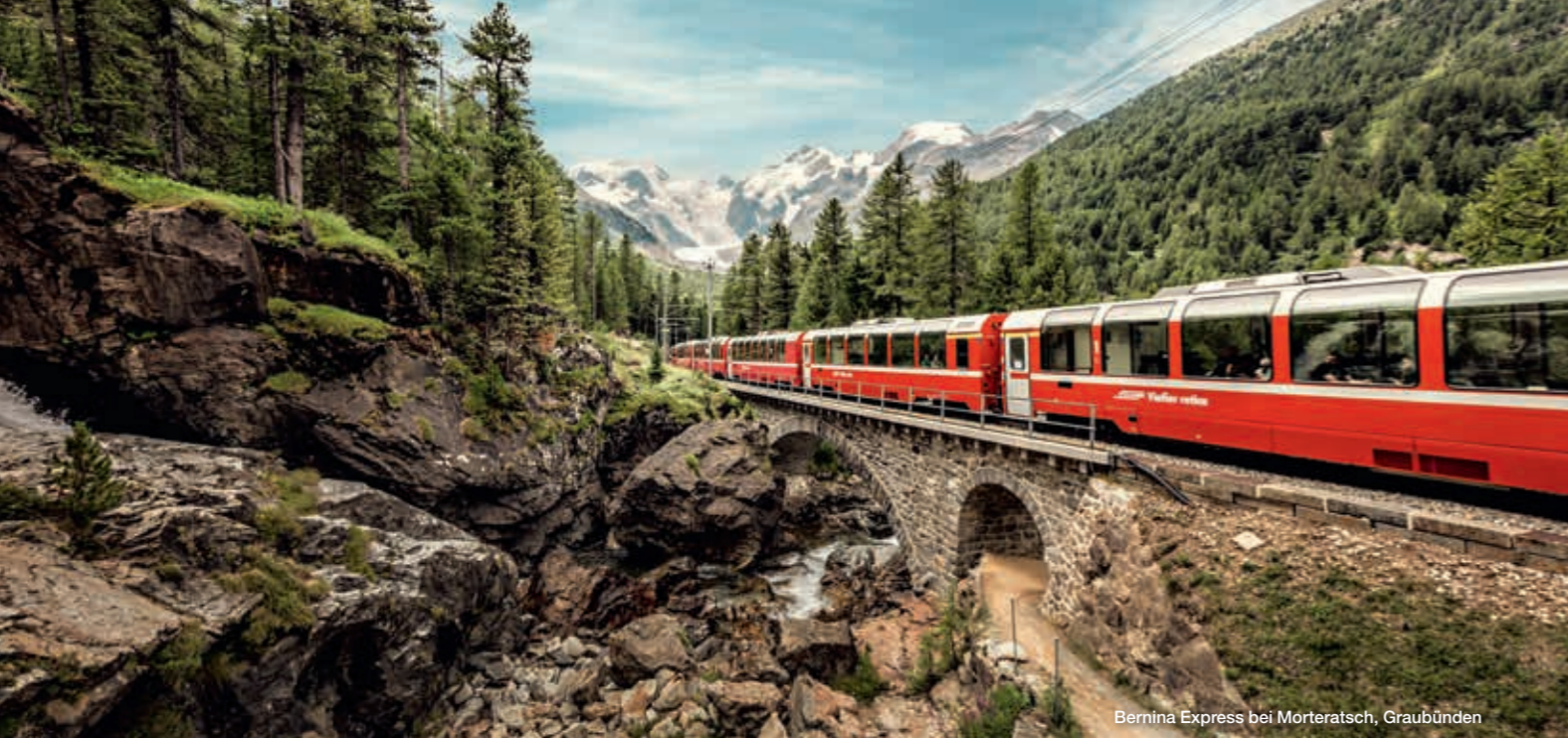
Bernina Express bei Morteratsch, Graubünden