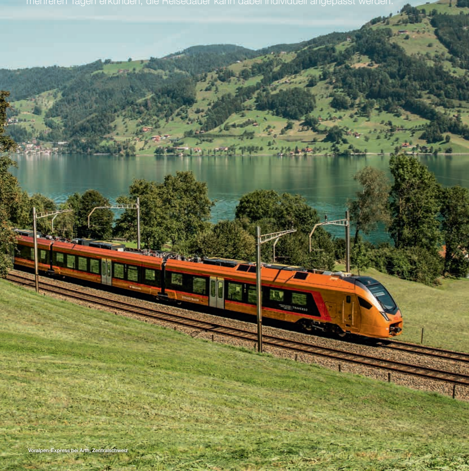
Voralpen-Express bei Arth, Zentralschweiz

Die nachfolgenden Reisevorschläge für die Grand Train Tour of Switzerland beinhalten panoramareiche Bahnfahrten und viele touristische Highlights. Jede Tour lässt sich in mehreren Tagen erkunden, die Reisedauer kann dabei individuell angepasst werden.