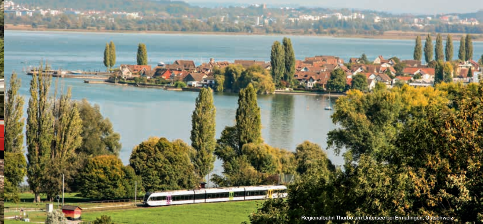
Regionalbahn Thurbo am Untersee bei Ermatingen, Ostschweiz